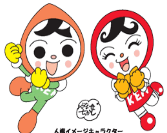
人権イメージキャラクター 人KENまもる君&人KENあゆみちゃん