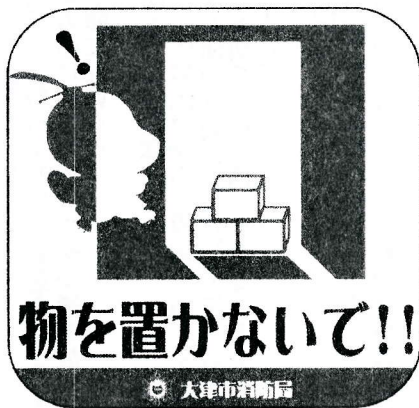
避難管理啓発ステッカー

大津市消防局では、「おおつ光ルくん」を活用した避難管理啓発ステッカーを作成し、事業所に配布しています。火災や地震等の災害が発生した場合に、安全に避難するために出入口・階段・通路等の避難施設を適切に維持管理することが大切です。